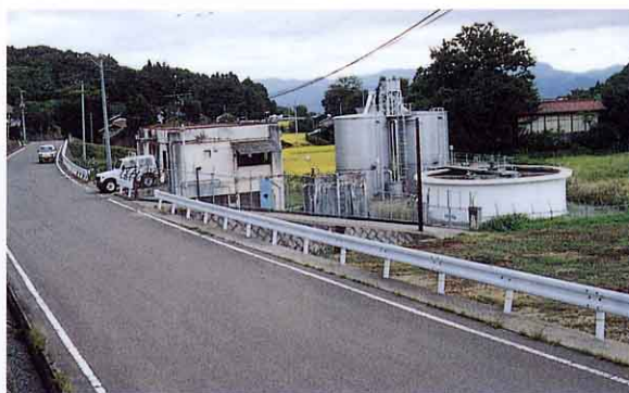
うちばばじょうすいじょう 内の馬場浄水場