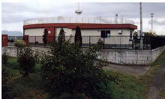
はいすいち 配水池 (平沢)