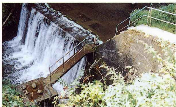
とりいれぐち 取入口 (産ヶ沢川)