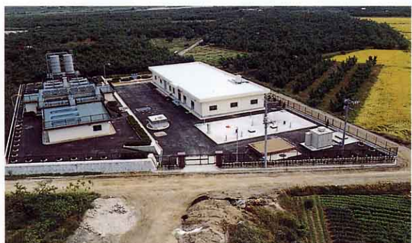
すなごきわじょうすいじょう 砂子沢浄水場