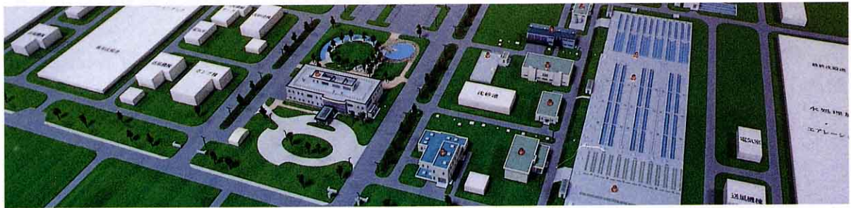
じょうか 県北浄化センター（国見町徳江）

私たちは生活していくうえで、さまざまな形で水を使っています。台所や風呂、洗たくや水洗便所などで使った後の生活は水や、工場から出される工場水は、年々増えています。そこで、桑折町では、福島市や近くの町と協力して、これらの下水をしまつする施設をつくることに力を入れています。