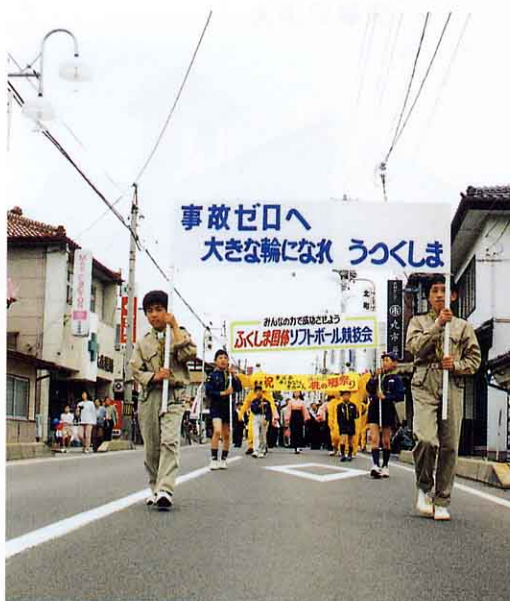
交通安全の呼びかけ