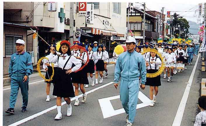
交通安全鼓笛隊パレード