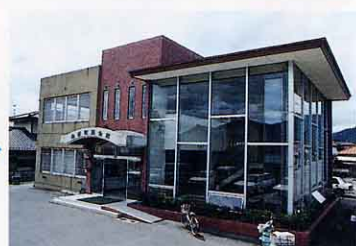
桑折公民館(町民会館)