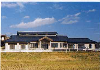
睦合ふれあい会館