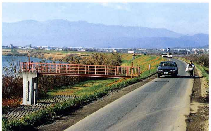
川の水量を調節する水門

桑折町では水防団が組織 そしき されています。大水が出ると出動して、救助活動 きゅうじょ を行います。