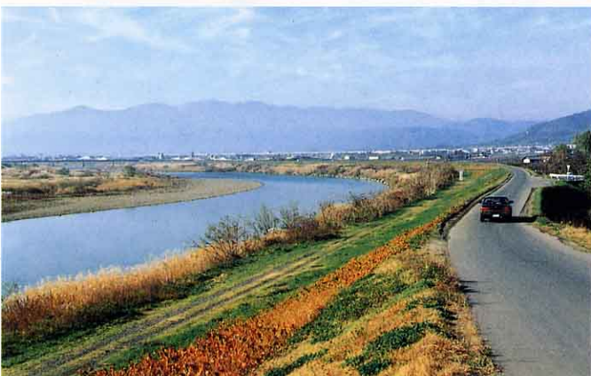
じょうぶに作り変えられた堤防 ていぼう