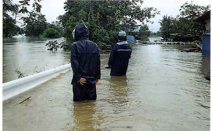
川ようになった道路