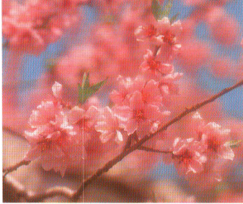
春の野を薄紅色に染め上げる、くだもの町にふさわしい花です。