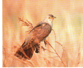
夏の野山にこだまする澄んだ鳴き声。自然が豊かな伊達町にふさわしい鳥です。