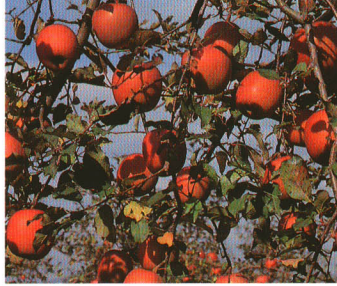
特産物のりんご。伊達町ならではの自然の恵みを生み出す木です。