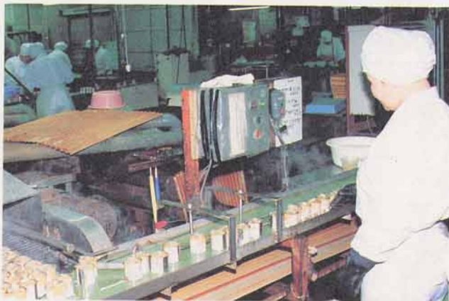
伊達町のかんづめ工場のようす (東北S.S.K食品)