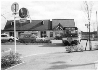
梁川駅からのバス

フリー区間のある路線では、バス停のないところでも乗り降りできるし、最近はお年よりや障害のある人にも乗り降りしやすいバスも工夫されてきています。