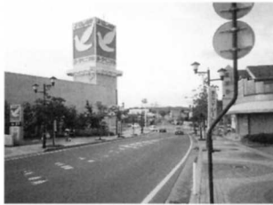
町のなかにはスーパーマーケットやお店がならんでいるね。