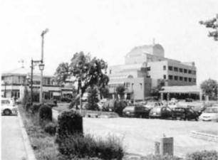
梁川駅前には役場や商工会があります。