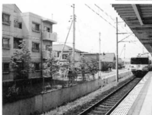
新田駅は新しいじゅうたく地の近く。