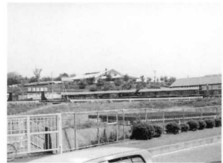
長い駅名ですね。希望の森へのげんかんです。プールやSLの駅も見えます。