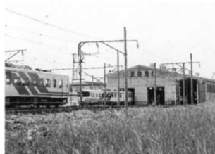
あぶくま急行の車りょう基地があるよ。