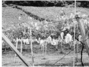
富野駅のまわりは、畑やかじゆ園が見られます。