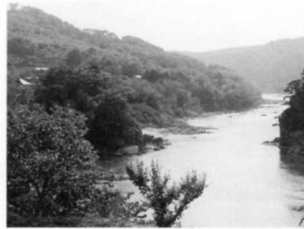
かぶと駅。山がせまりあぶくま川もせまくなってきた。