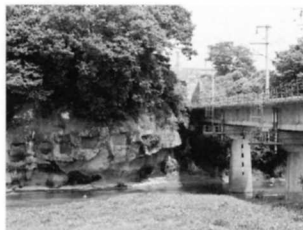
広瀬川をわたる鉄橋。近くでパレオパラドキシアが発見されました。