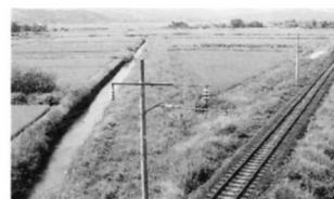
水田の中をまっすぐつづく線路。