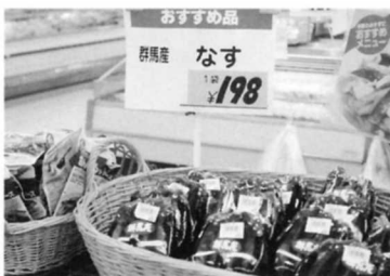
⑧ なす (群馬から)