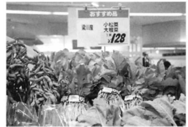
⑥ 小松菜 (梁川)