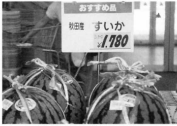
④ すいか (秋田から)