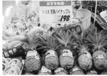
② パイナップル (フィリピンから)