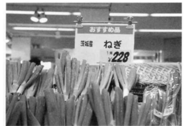
⑦ ねぎ (茨城から)