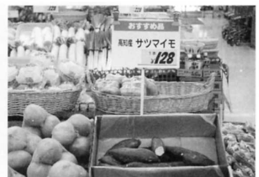
⑩ サツマイモ (高知から)