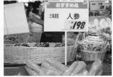
③ 人参 (北海道から)