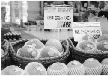
⑤ メロン (山形から)