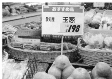
⑨ たまねぎ (愛知から)