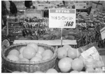
① グレープフルーツ (アメリカから)