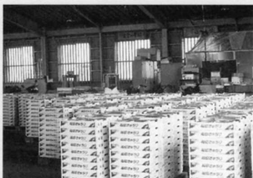
J Aの選果場に集められます