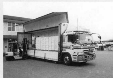
冷凍車で各地に送られます