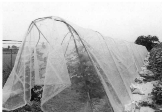
さんざネットで害虫をふせぐ。