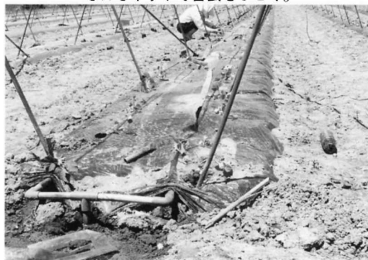
なえの下に水のパイプを通してている。