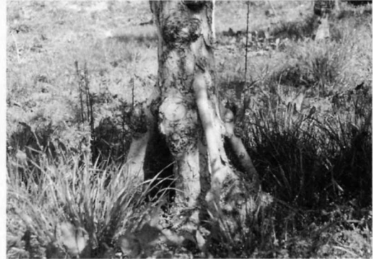
根が悪くなると、新しい根をつぎ木します。