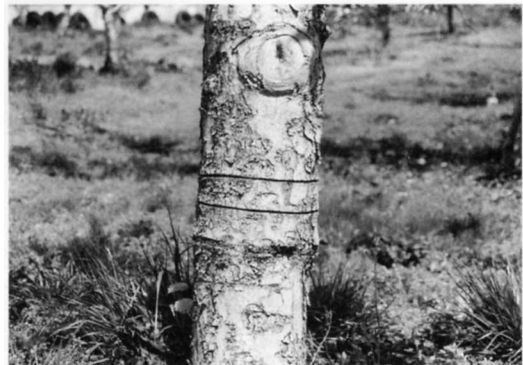
よい花を咲かせるために、みぎにきずをつけます。