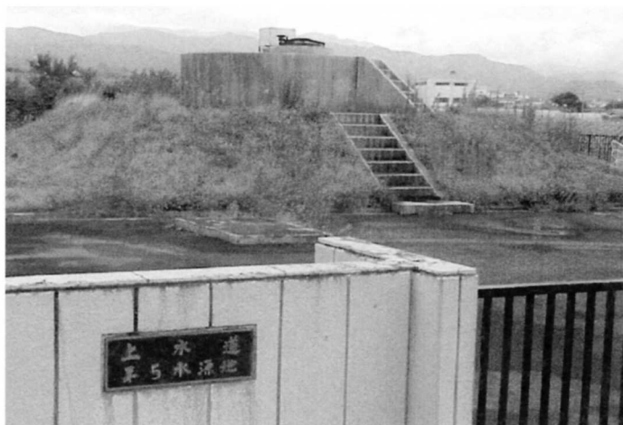
上水道の水げん地（栗野地区）

梁川町の水道は、地下水を利用して います。水道の使用量が年々増えるに つれて、地下水の確保が か できなくなる 心配 しんぱい もあります。