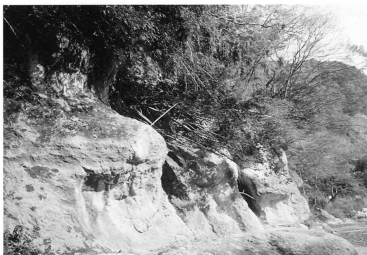
堅刈の難所 (福島市湯野)

毎年新しい米をそなえてお祭りをし、私達のために努力をしてくれた方々へ感謝をしています。