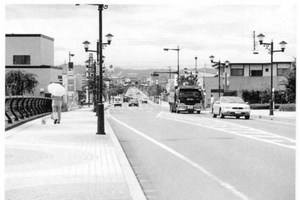
平成のはじめのころの広瀬橋