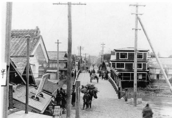
大正のころの広瀬橋