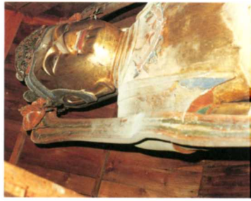
①十一面観世音菩薩像(雷野・取湯観音)

梁川町には、県指定の文化財が4つ、町指定のものが34あります。むかしの人々が残した文化財をいっまでも残しておくために、町内のおもな文化財の指定をしてそれらの保存につとめています。