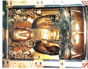
④木蓮地蔵菩薩坐像(梁野)