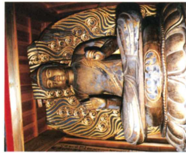
⑤木蓮聖観音菩薩坐像(梁川・古町観音)