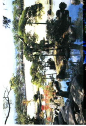
(a) 梁川城跡及び本丸庭園(梁川)