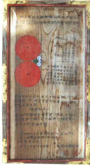
②八幡神社奉納算額(雷野)