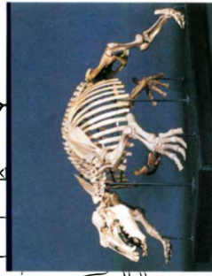
パレオパラドキシア(骨格復元)