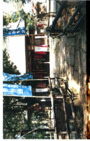
(b) 梁川龍岡八幡宮及び旧別当寺境域(雷野)