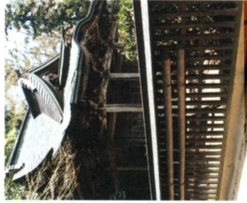
②八幡神社本殿(雷野)