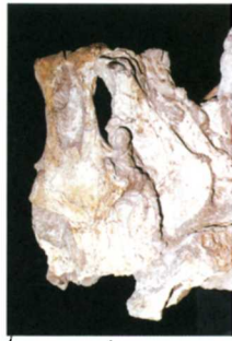
(c) パレオパラドキシア化石(梁川)