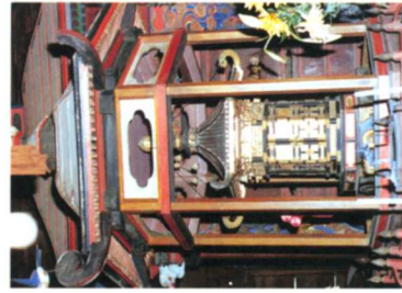
⑤木蓮六角門聖厨子(梁川)