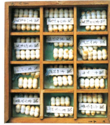
③中村家蔵標本一式(梁川)