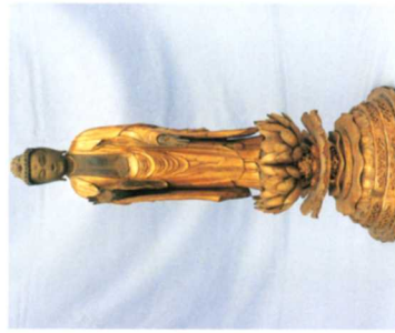
②木蓮阿弥陀如来立像(梁野)