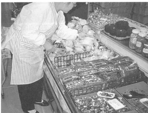
品物をならべる人