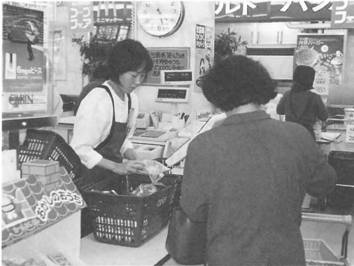
レジのかかりの人