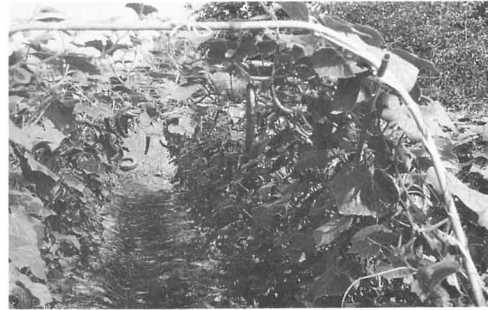
きゅうりのさいばい (堰本)