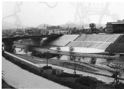
今の広せ橋から中町通りをみる (梁川地区)