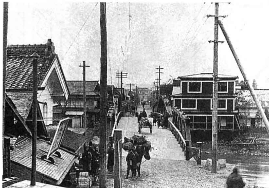
大正時代のころの広せ橋から中町通りをみる (梁川地区)