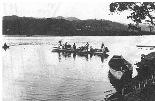
明治41年 梁川舟場の風景