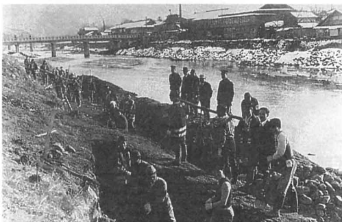
広瀬川の堤防工事