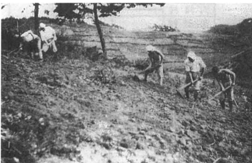
戦時中の食料増産風景