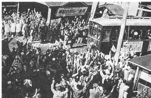
梁川駅で出征兵を見送る人