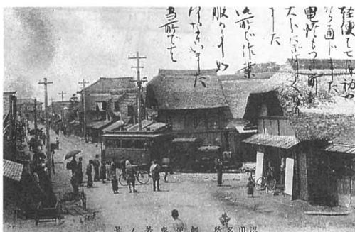
軽便鉄道到着風景