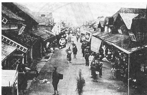
明治末の梁川の糸市