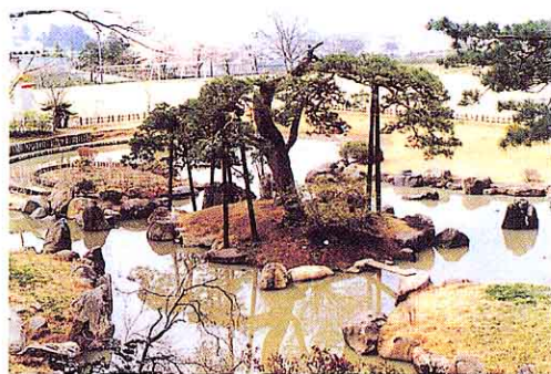
てんねん きんねんぶつ ていえん (a)梁川城跡及び本丸庭園 (梁川)