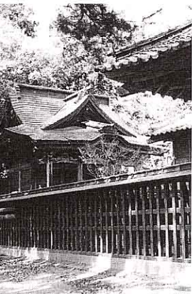
はちまん ほんでん ②八幡神社本殿 (富野)

が3つ、町指定のものが29あります。むかしの人々の残した文化財をいつまでも残しておくために、町内のおもな文化財の指定をしてそれらの保存に努め、祭りの時にしか見られない無形のもの、その場所に行けば見られる有形文化財や自然の中にある天然記念物のようなものもあります。わたしたちの