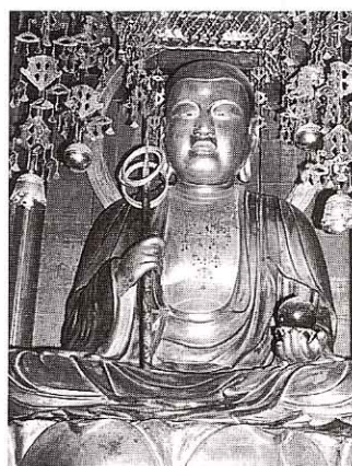
もくぞうじぞうぼつざつざぞう ④木造地藏菩薩坐像 (栗野)