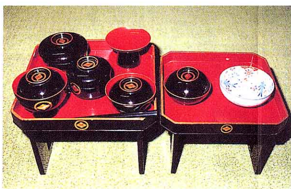
まつまえけ きんせんわん ⑥松前家寄進膳碗一式 (梁川)