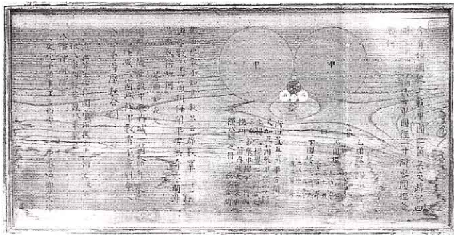
はちまん ほうのうさんかく ②八幡神社奉納算額 (富野)