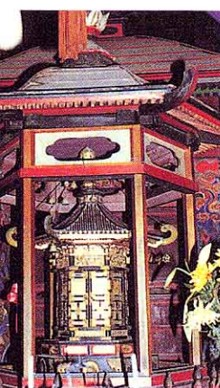
もくぞうろくかくえんどうずし ⑤木造六角円堂厨子 (梁川)