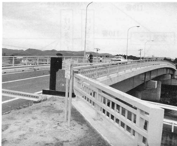
(梁川地区、 ばんだいぼし 万代橋)