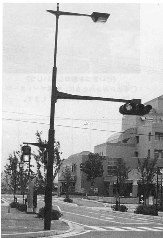
○歩く人のための信号もつけられています。(梁川駅前)