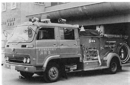
ポンプ車 (北ぶんしょ)