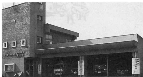
北ぶんしょ (梁川町)