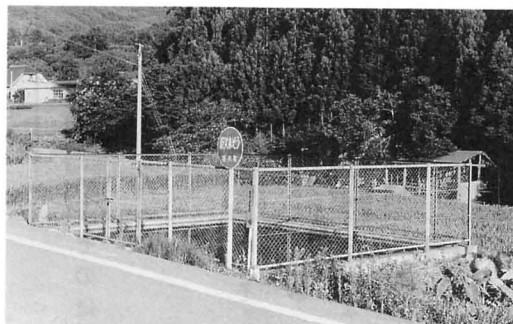
防火水そう（白根地区）