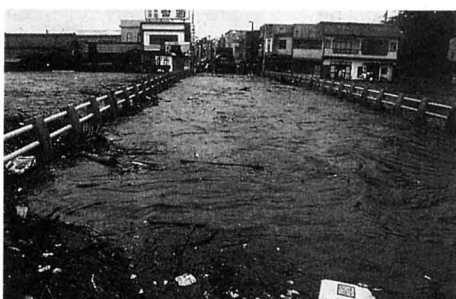
昭和61年の大水のひがい (梁川地区)