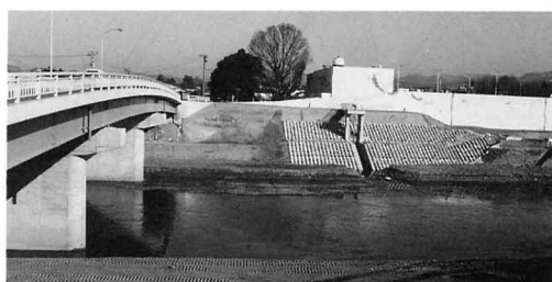
大水をふせぐため、ていぼうが高くなっています。(梁川地区)