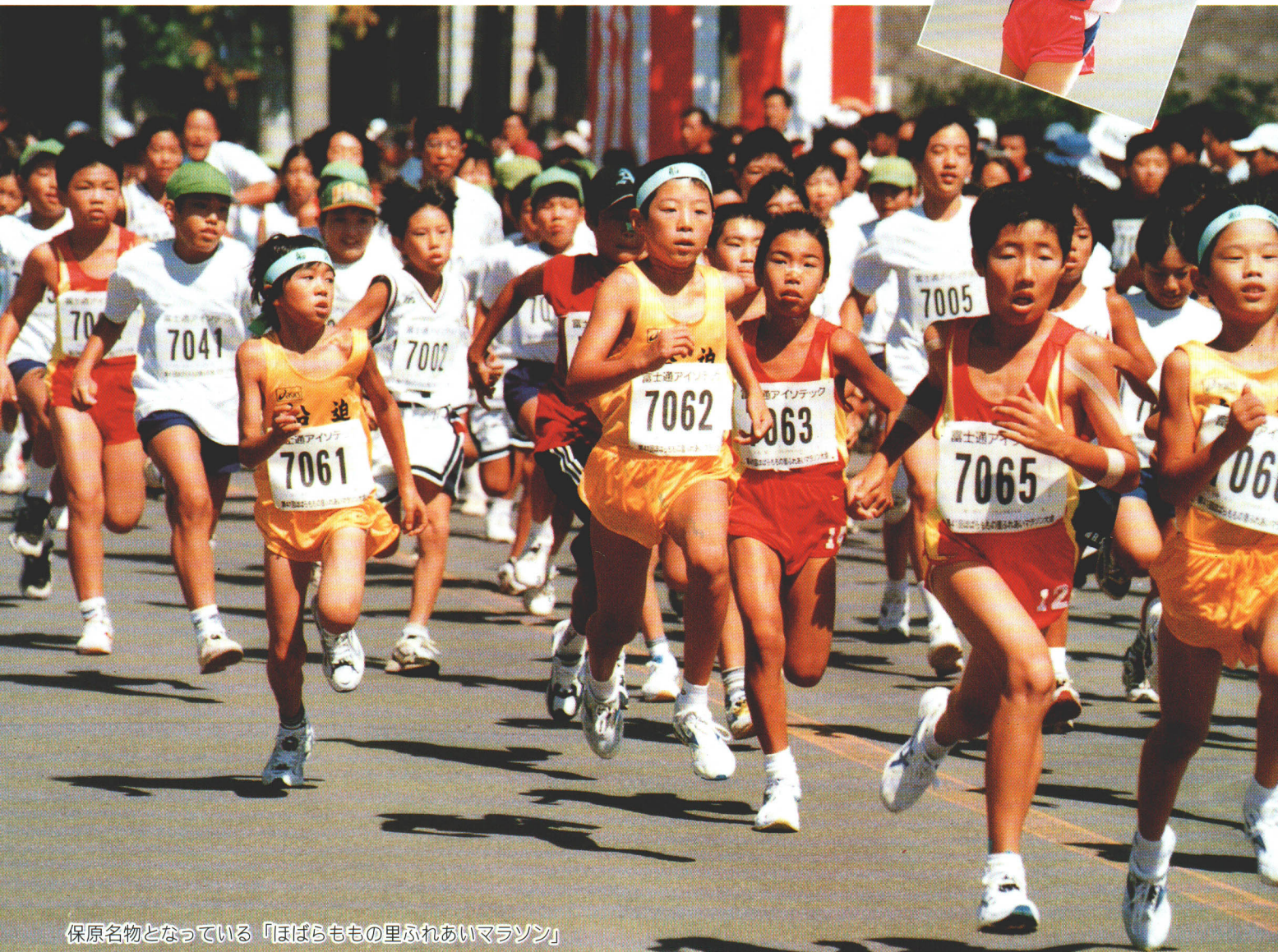
保原名物となっている「ほばらももの里ふれあいマラソン」