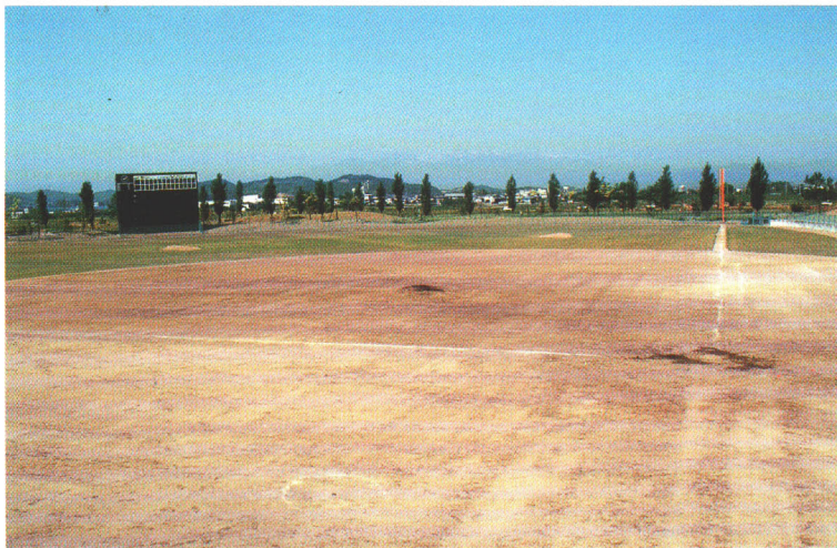
▲総合公園内の野球場