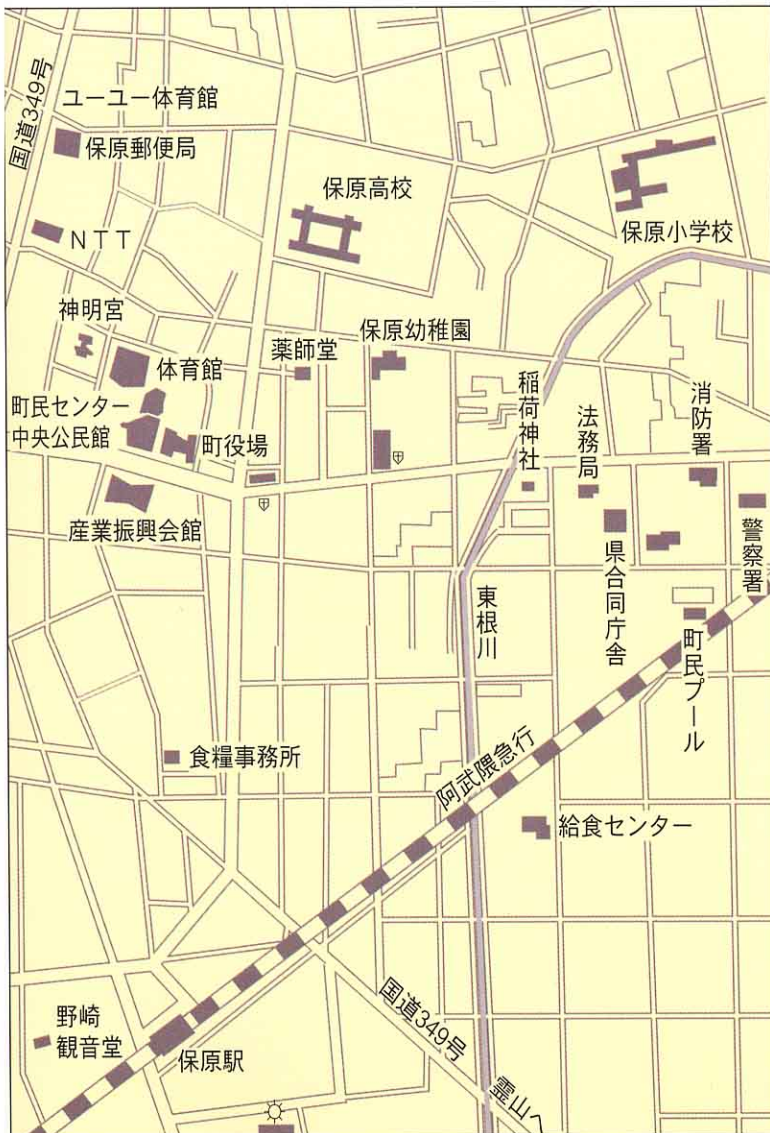
▲ 町の中心部とおもな施設