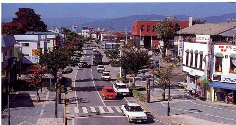
▲ 陣屋通り(町のシンボルロード)

陣屋通りには、十分な歩道がもうけてあり、各種催しが行われるなど住民のいこいの広場ともなっています。