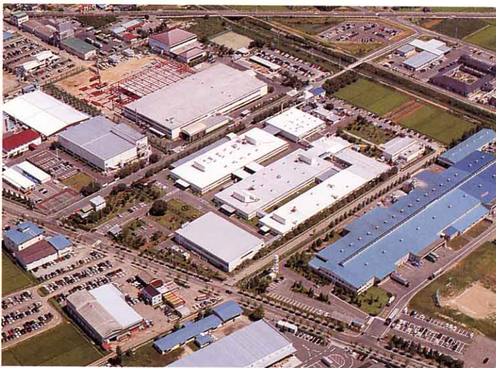
▲ 富士通アイソテック福島工場