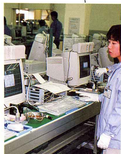
▲ かんさけんさ 監査検査