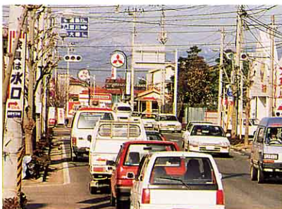
▲ 1丁目交差点 福島へ向う車