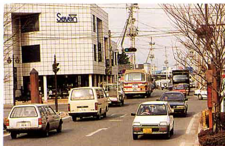
▲ 朝つうきんの車でこみあう道路