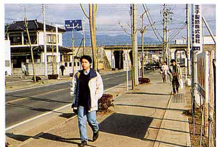
▲ 近くの人自転車や歩いてつうきん