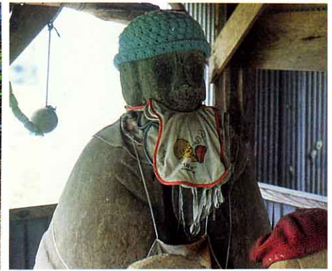
▲ 子そだて地ぞう わが子のために、死んでゆうれいとなって掛田でアメを買い、おちちのかわりになめさせたという言い伝えがある朝日の前という人をまつたと、つたえられている。③