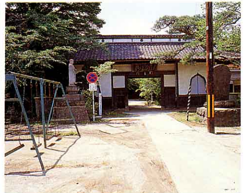
長谷寺山門 今からやく200年前、保原町宮下には陣屋がありました。明治維新に代官所がはい止されたので、その門が長谷寺にうつされ、今にひきつがれています。⑦ ▼