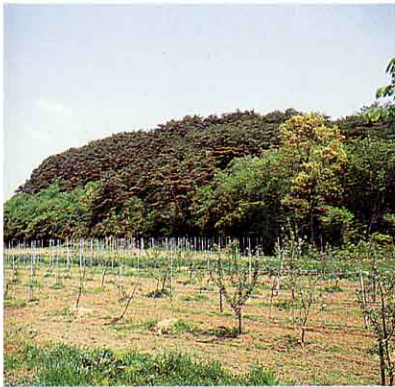
高子たてあと 今から800年ぐらい前、伊達郡をおさめていた中村（伊達）朝宗のお城があったところ。①