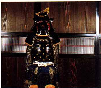
伊達家ゆかりのよろい。