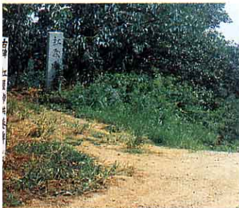
紅屋峠 保原から掛田、相馬に行く時、この峠でひと休みしました。④