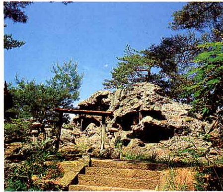
▲ 岩谷かんのん かわった岩のところどころに小さいどうくつがあり、そこに薬師り光如来がまつられています。②