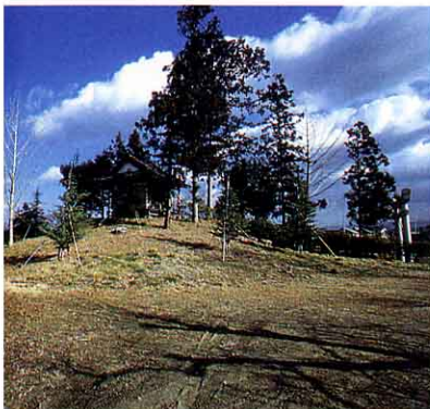
大塚古ふん 大むかし、このふきんをおさめていた人のおはかです。⑤ ▼