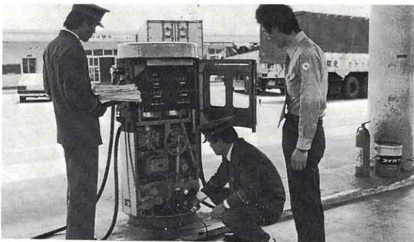
▲ きけん物のけんさ