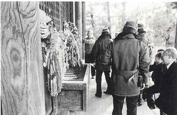
▲ 文化ざいのぼう火てんけんをします。