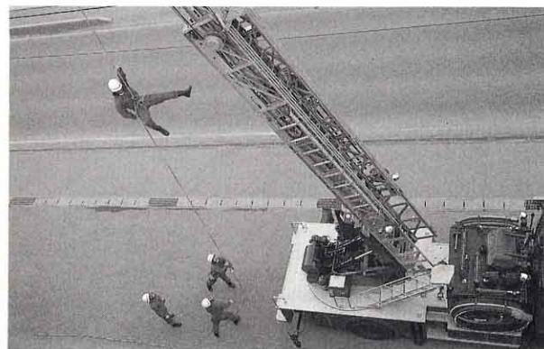
▲ 高いところできゅう助くんれんをします。