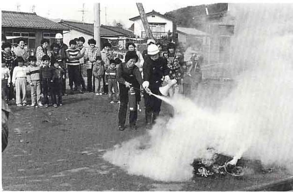
▲ 消火きの使い方をおしえます。