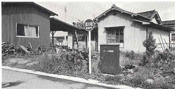
▲ 消火栓 (大田)