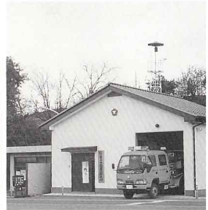
▲ 柱 沢