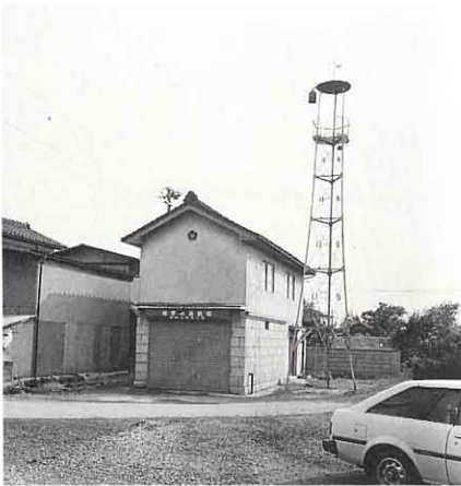
▲ 大 田