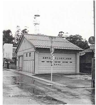
▲ 保 原