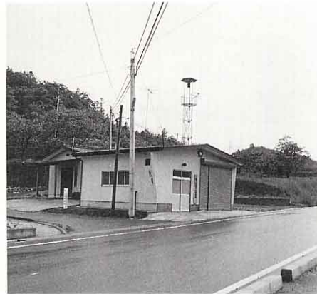
▲ 富 成