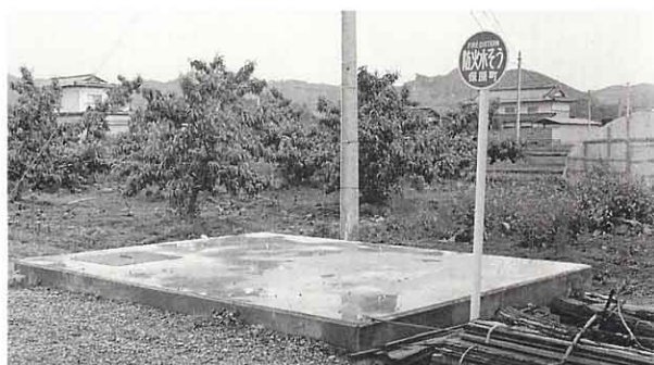
▲ 防火水そう (柱沢)