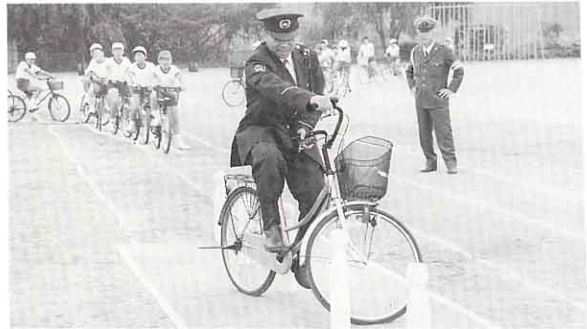
▲ 交通教室にいて正しい自転車の乗り方をしどうします。