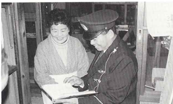
▲ 地区の人からいろいろ話を聞いて、住民の安全にやくだてています。