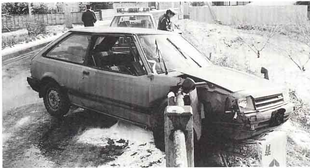
▲ じこの場所によって、事故がおこった原因を調べています。