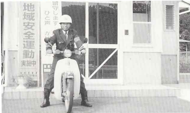
▲ 地区を毎日パトロールします。