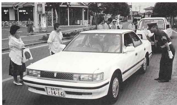
▲ 道行くドライバーに安全運転をおねがいでいます。