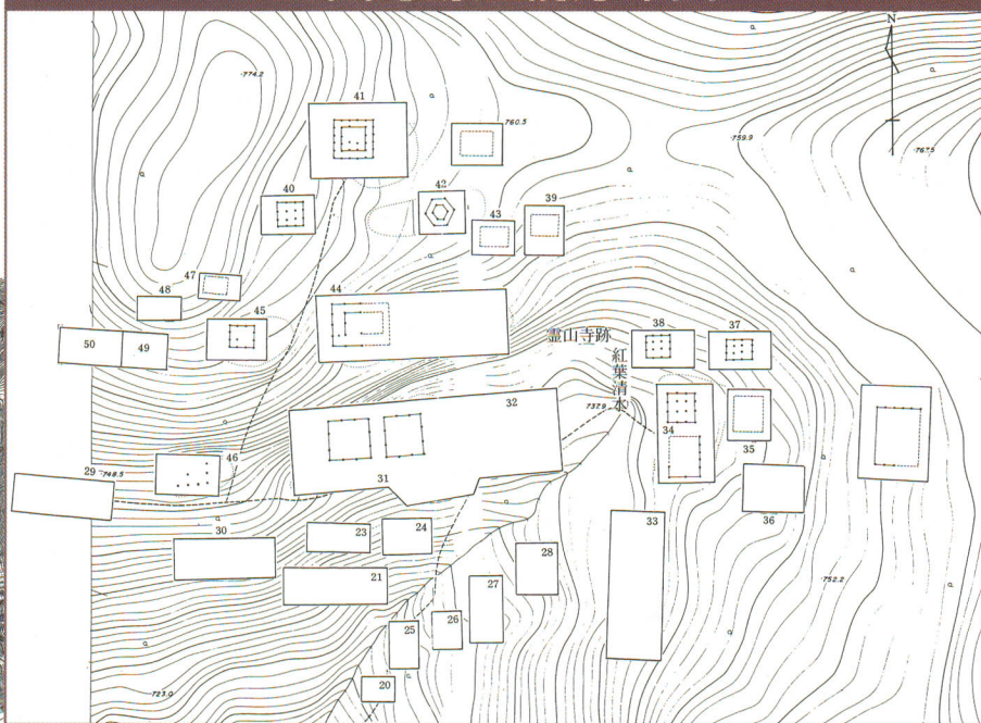
● 霊山寺跡遺構分布図 ●