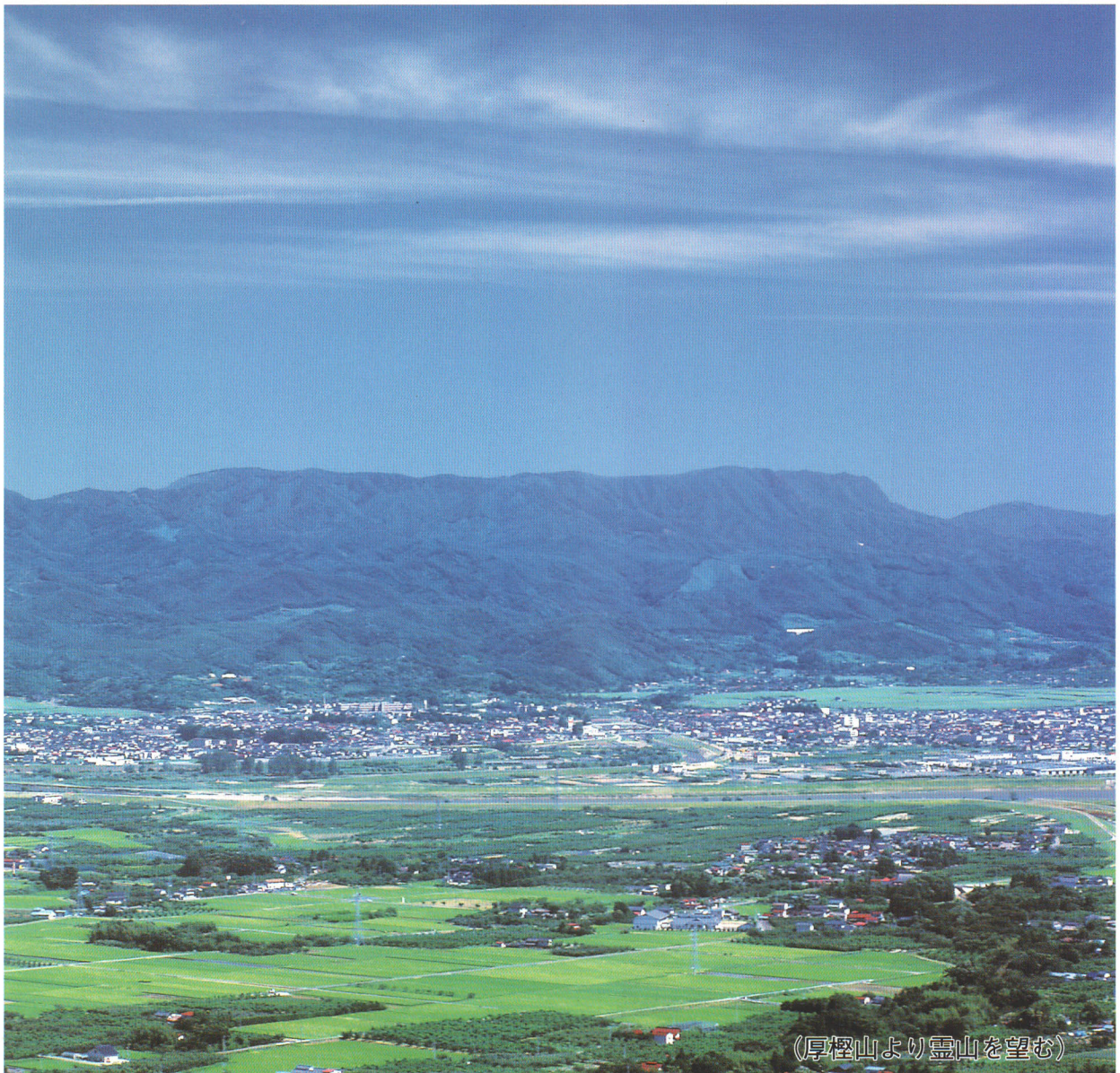
(厚樫山より霊山を望む)