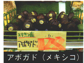
アボガド (メキシコ)