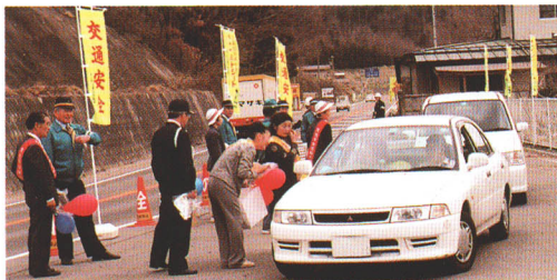
安全運転を呼びかける てんぷらむら テント村作せん