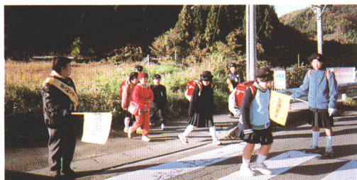
交通安全母の会による とうこうしどう 登校指導