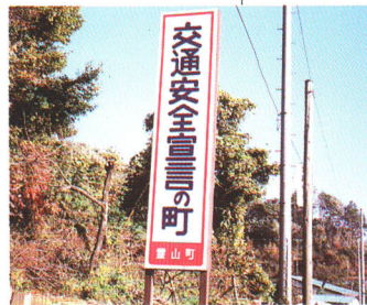
安全を守る とく いろいろな取り組み