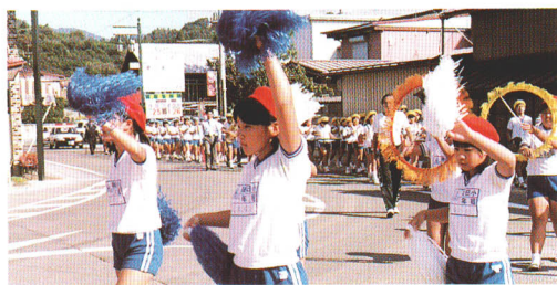
交通安全を呼びかける よこてきたい 鼓笛隊パレード