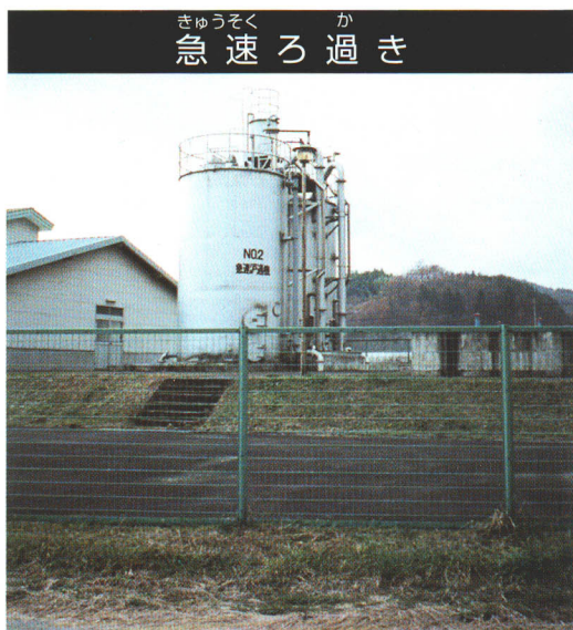
きゆうそく か 急速ろ過