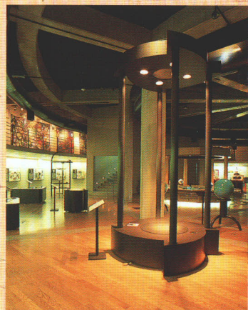
遊びと学びのミュージアム (1F)