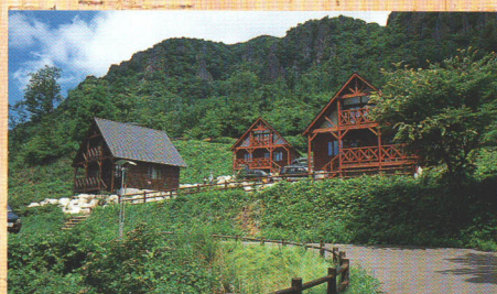
木立の中にあるコテージ

なっているリビングは、開放感いっぱい です。キッチンやバス、トイレのほかに、冷 蔵庫と電子レンジもある快適さ。親子連れ でも安心の宿泊 施設です。