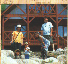
コテージには楽しさいっぱい

なっていて 定員は六名。 広々とした リビングス ペースのほ かに洋室 （ブレイク ム）やベッ ドルームも あります。 吹き抜けに なっているリビングは、開放感いっぱい です。キッチンやバス、トイレのほかに、冷 蔵庫と電子レンジもある快適さ。親子連れ でも安心の宿泊施設です。