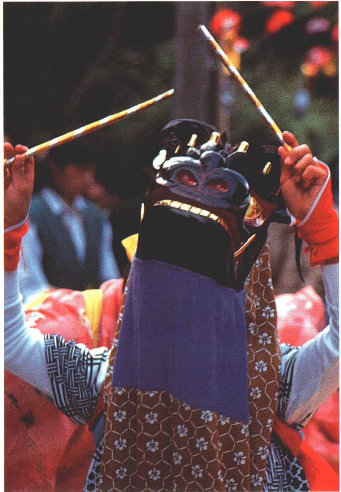
小志貴神社牡丹獅子舞

歴史ある月館を感じさせる祭りに「獅子舞」があります。現在、町内で催されるのは、布川地区の熊野神社、御代田地区の羽山神社に伝わる三匹獅子舞と、上手渡地区の小志貴神社の牡丹獅子舞の二つで、古来からの伝統を受け継いだ優雅な舞いに、毎年多くの見物客を迎えています。特に、永久五年（二一七年）の勧請といわれるへ小志貴神社の牡丹獅子舞は、獅子にまつわる一連の物語にあわせて舞いが奉納される古式ゆかしいもの。主役となる子供たちは、祭りにあわせて何カ月にもわたって練習を重ね本番を迎えます。