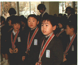
月館町体育文化表彰式