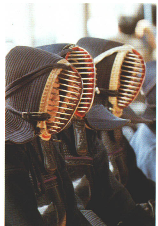
愛宕スポーツ少年団

指定「体力づくり推進校」に、月館中学校では、平成三年度に文部省「生徒指導総合推進校」の指定を受けたほか、小手小学校でも、花いっぱいコンクール、世界児童画展県団体賞など受賞しています。スポーツ面においては、愛宕、女神スポーツ少年団があり、また平成五年には月館中学校の女子バレー部が全国大会に出場するなど、中体連等でも優秀な成績を収めており、町では毎年体育や文化面で活躍された児童、生徒を表彰しております。 そして今後も自由な環境のなかで、このような子供たちの資質を一層高め、視野を広げ、健やかな成長を見守っていきけるよう、地域ぐるみでの教育環境づくりを推進しています。