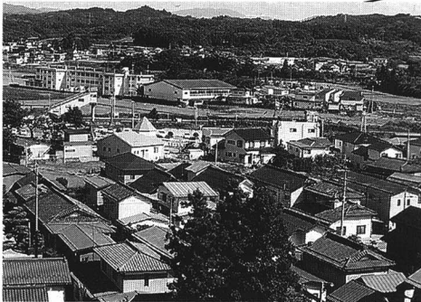
家や店の多いところ（杉田地区）