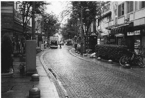
カーブをつけ、歩道 だんさ と段差のない道路 (パセオ470通り)