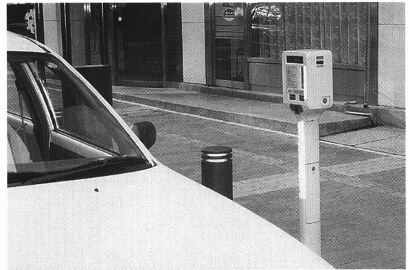
パーキングメーター