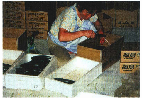
はこづめ(せんべつ)