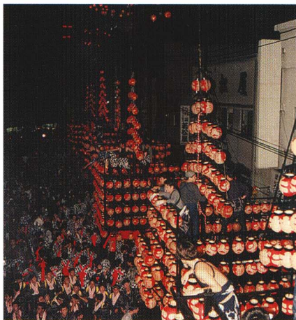
二本松ちょうちんまつり