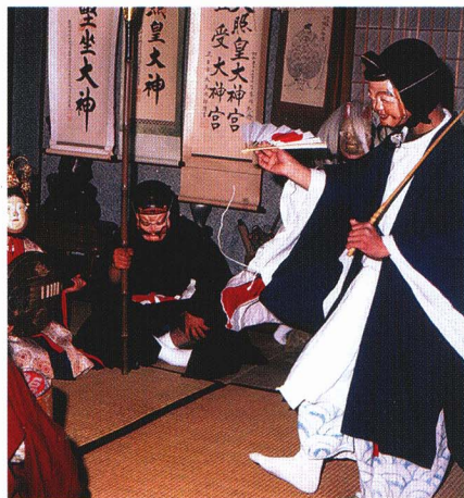
しちふくじん 石井の七福神