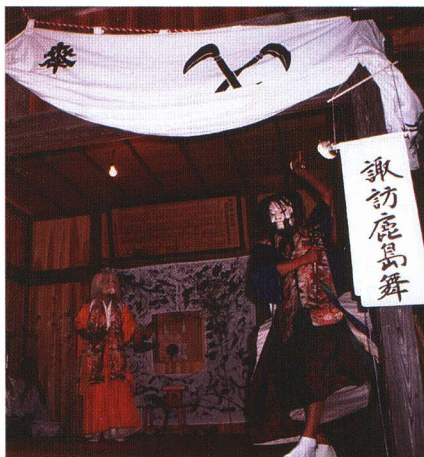
はらせ だいだいかぐら 原瀬の太々神楽