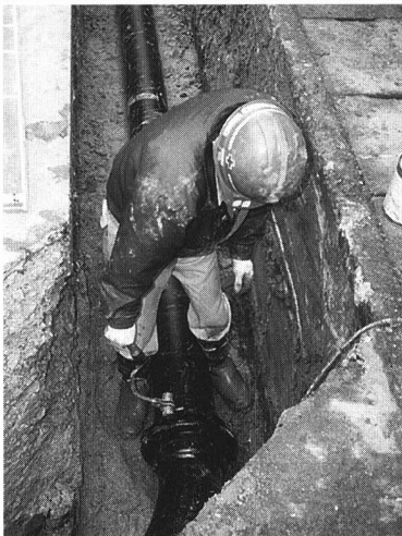
配水かんをつなぐ作業