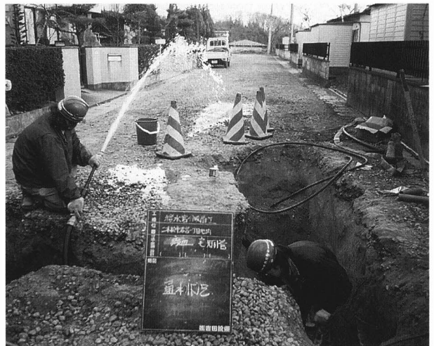
水の通り具合を調べる作業