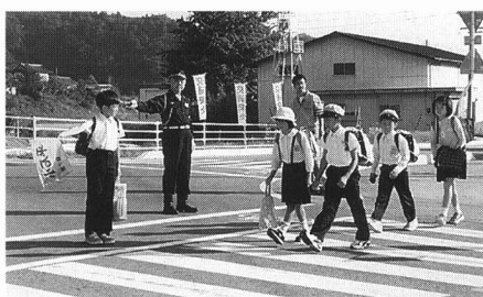
しどう 朝の交通指導