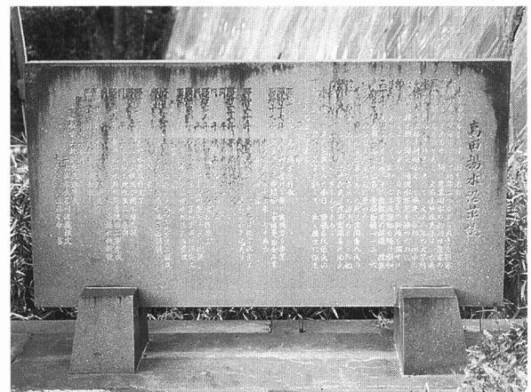
お お い し よ う す い 大石揚水の記念ひ