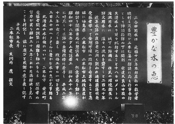
に ごう だ 二合田用水の記念ひ