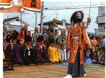
▲油井神社 十二神楽