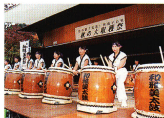
▲道の駅「安達」収穫祭